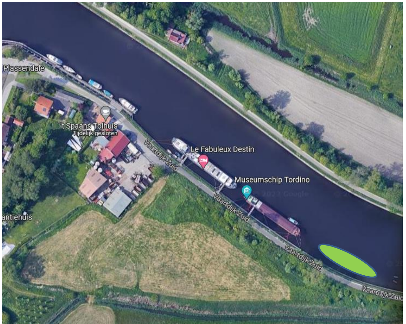
Situering ligplaats aansluitend bij museumschip "Tordino"

Qua positionering dient voor het aanmeren van het bijkomend vaartuig rekening gehouden met volgende factoren :