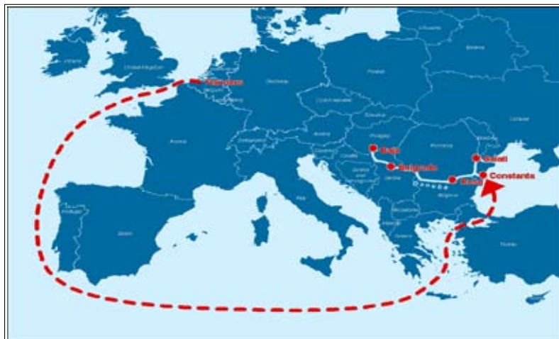
Illusztráció: A Flandria – Románia – Bulgária – Szerbia – Magyarország közötti intermodális kapcsolat

Az ILDE-projekt egy Flandria, Románia, Bulgária, Magyarország és Szerbia közötti előnyös és költség-hatékony belvízi hajózási kapcsolat kiépítésének lehetőségét vizsgálja. A fentiek a Nyugat-Európából érkező szállítmányok szempontjából fontosabb szerepet játszó CEEC-országok. Különösen fontos a Dunán történő intermodális vízi szállítás (IWT) lehetőségeinek vizsgálata. A Rajna-Majna-Duna csatorna infrastrukturális problémáinak kiküszöbölésére a rövid távú tengeri szállítás (SSS) lehet a megoldás Flandria és a Konstanca-i Kikötő között, ahonnan az uszályokra történő átrakodást követően román, bolgár, magyar és szerb belvízi kikötőkbe szállítható az áru (ld. 1.1. ábra)